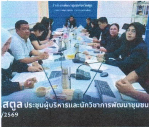
สตูล ประชุมผู้บริหารและนักวิชาการพัฒนาชุมชน /2569